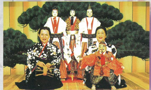
阿波木偶箱まわし保存会