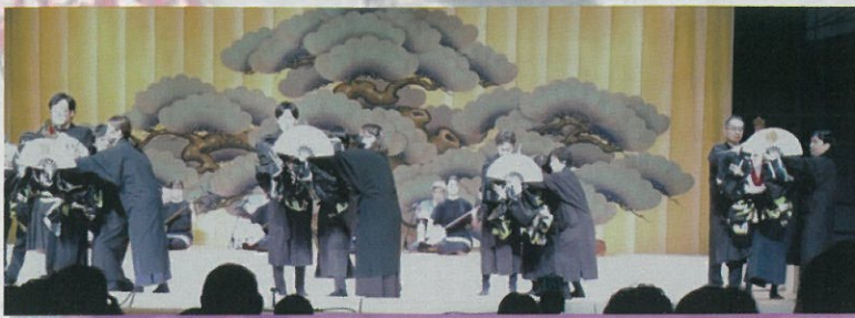
青年座 & ポラリス座