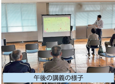
午後の講義の様子