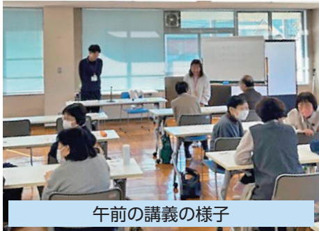
午前の講義の様子