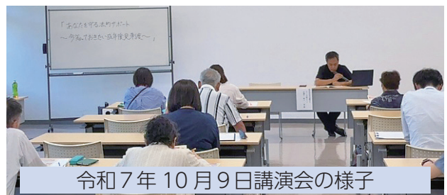
令和7年10月9日講演会の様子